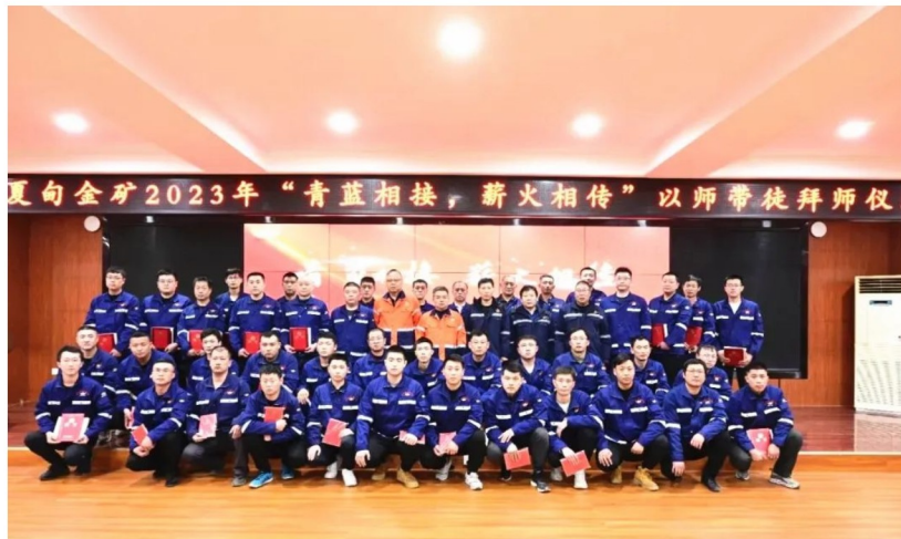
夏甸金矿2023年“青蓝相接，薪火相传”以师带徒拜师仪式